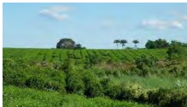
Monocultura até anos 1990