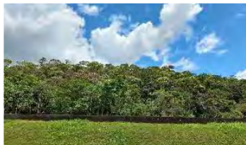
Abandono, regeneração florestal Anos 1990 a 2020